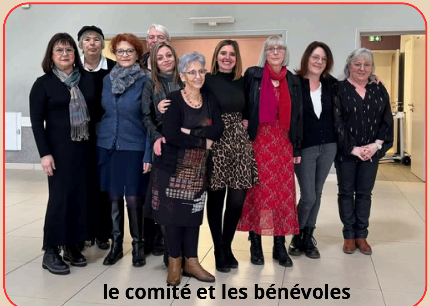
le comité et les bénévoles